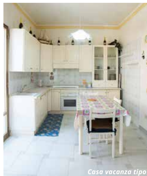
Casa vacanza tipo