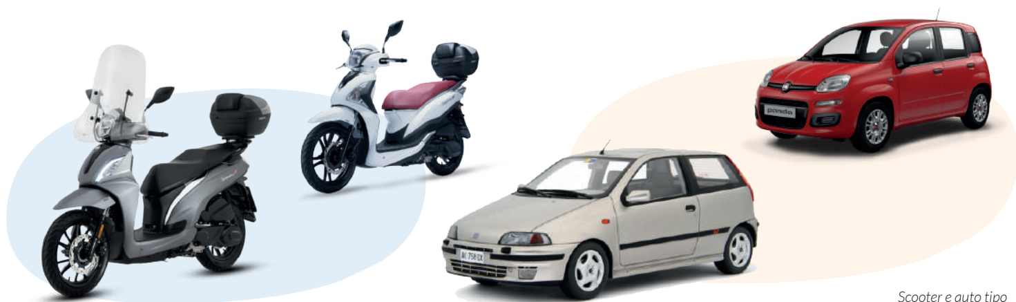
Scooter e auto tipo

Le quote per mezzo includono: nolo auto/scooter/quad per 7 giorni con consegna/riconsegna presso il proprio hotel/appartamento; km illimitato; assistenza sull'isola, assicurazione contro terzi RCA (con franchigia). Le quote non includono: assicurazione Casco a pag. in loco (facoltativa), carburante, multe per infrazioni al codice della strada, assicurazioni supplementari, quanto non specificato nella voce "Le quote includono". Importante: non è necessaria la carta di credito per noleggiare auto/scooter/quad.