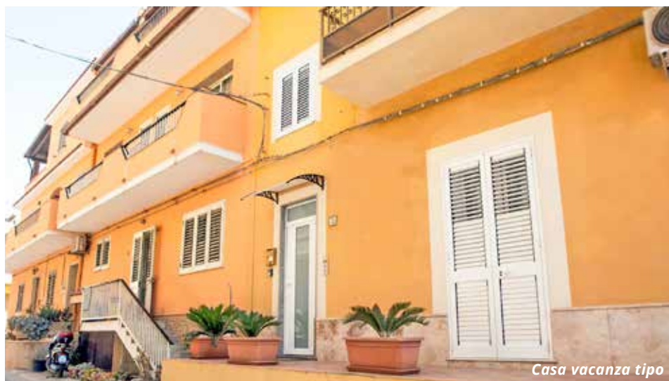
Casa vacanza tipo

A max 2-3 km dagli appartamenti. Lampedusa offre bellissime calette di roccia e sabbia e spiagge di sabbia libere e attrezzate come la Guitgia. La splendida spiaggia dei Conigli si trova a circa 7 km da Lampedusa Paese.