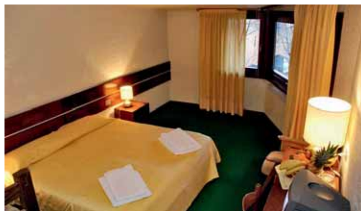
Hotel Club Montecampione - quote per persona